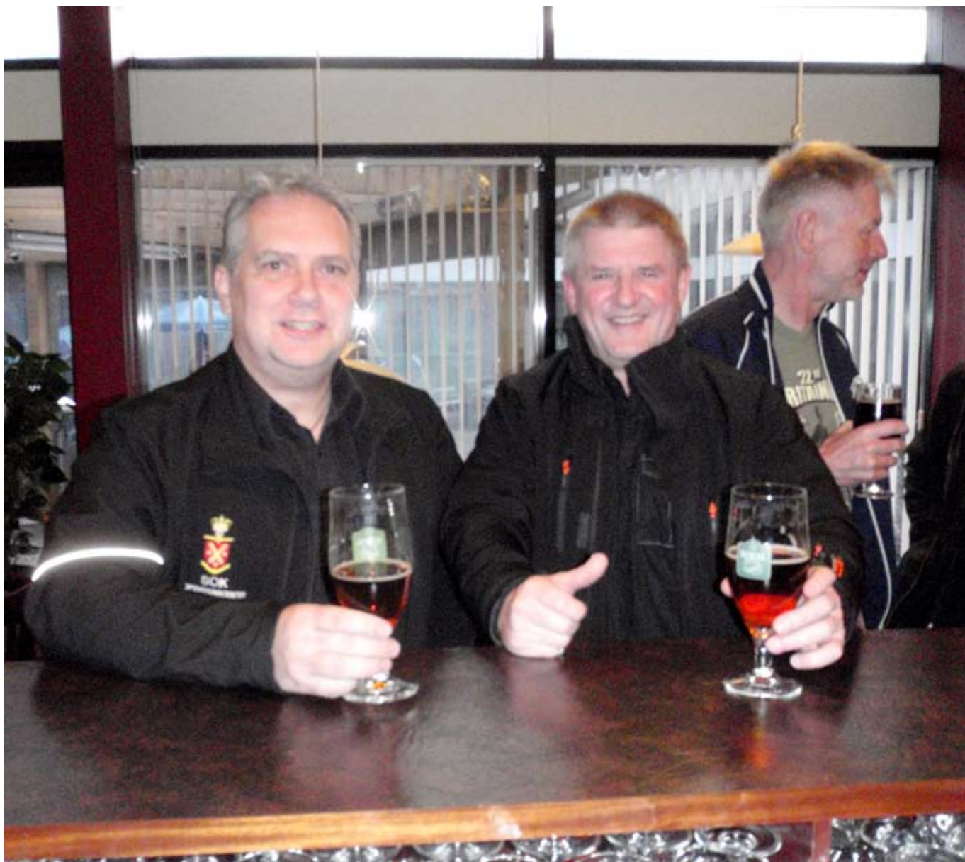
Præmie - eller måske trøstepræmien nydes